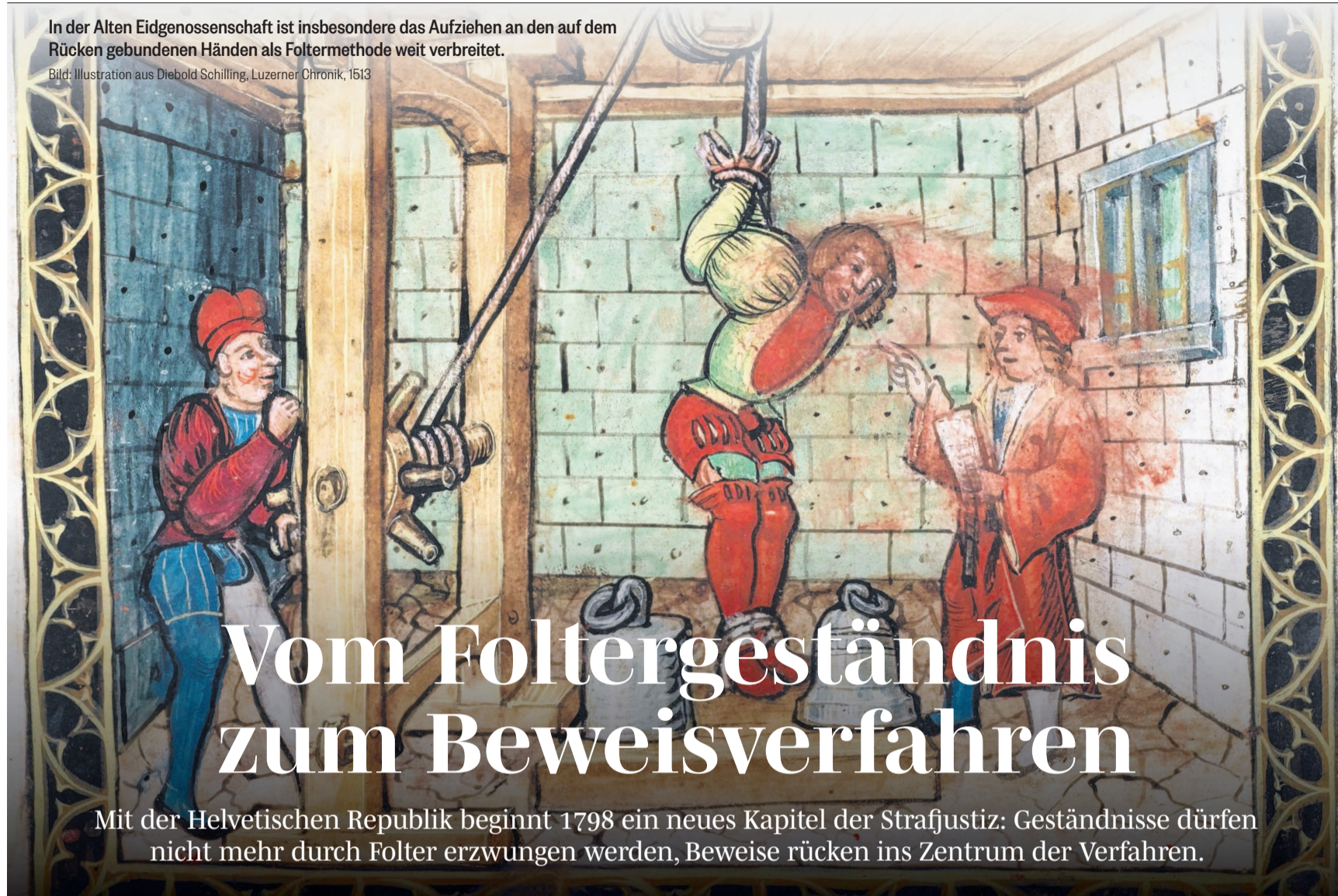
In der Alten Eidgenossenschaft ist insbesondere das Aufziehen an den auf dem Rücken gebundenen Händen als Foltermethode weit verbreitet. Bild: Illustration aus Diebold Schilling, Luzerner Chronik, 1513