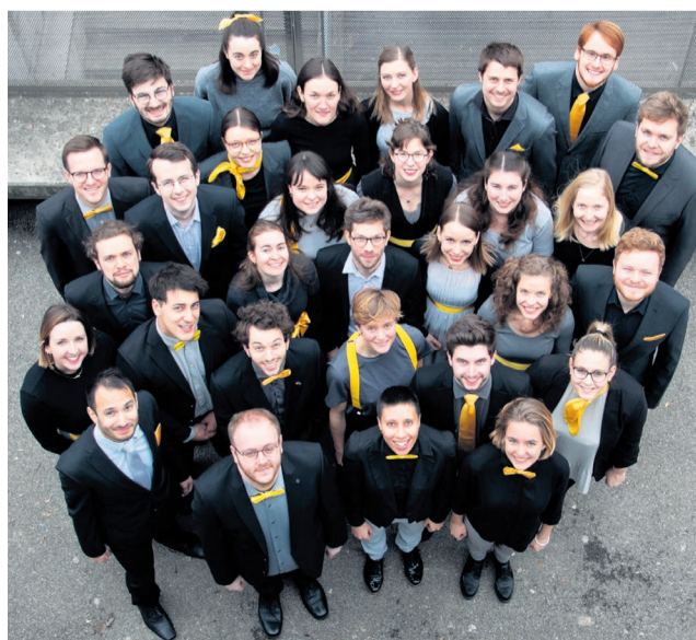
Gemeinsam zusammenklingend und harmonisch bis zur Höchstleistung lautet das Credo.

Von der kraftvollen Erhabenheit eines «When I Need A Friend» von Coldplay