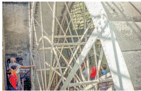
Der Krebsbach hat vieles schon erlebt: Kriegs- und Naturgewalt, Papier-, Auto- und Textilfabriken bis zum heutigen Krebsbachweg als Naherholungsgebiet.