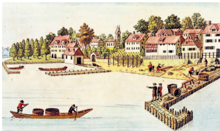
Der Handel führte damals noch meist über den Zürichsee – überhaupt dürfte der See früher eine viel grössere Bedeutung im Alltag der Menschen gehabt haben.

Interessierten herzlich auf diesen Freitag um 20 Uhr ein. Der Eintritt ist wie immer frei. (eing)