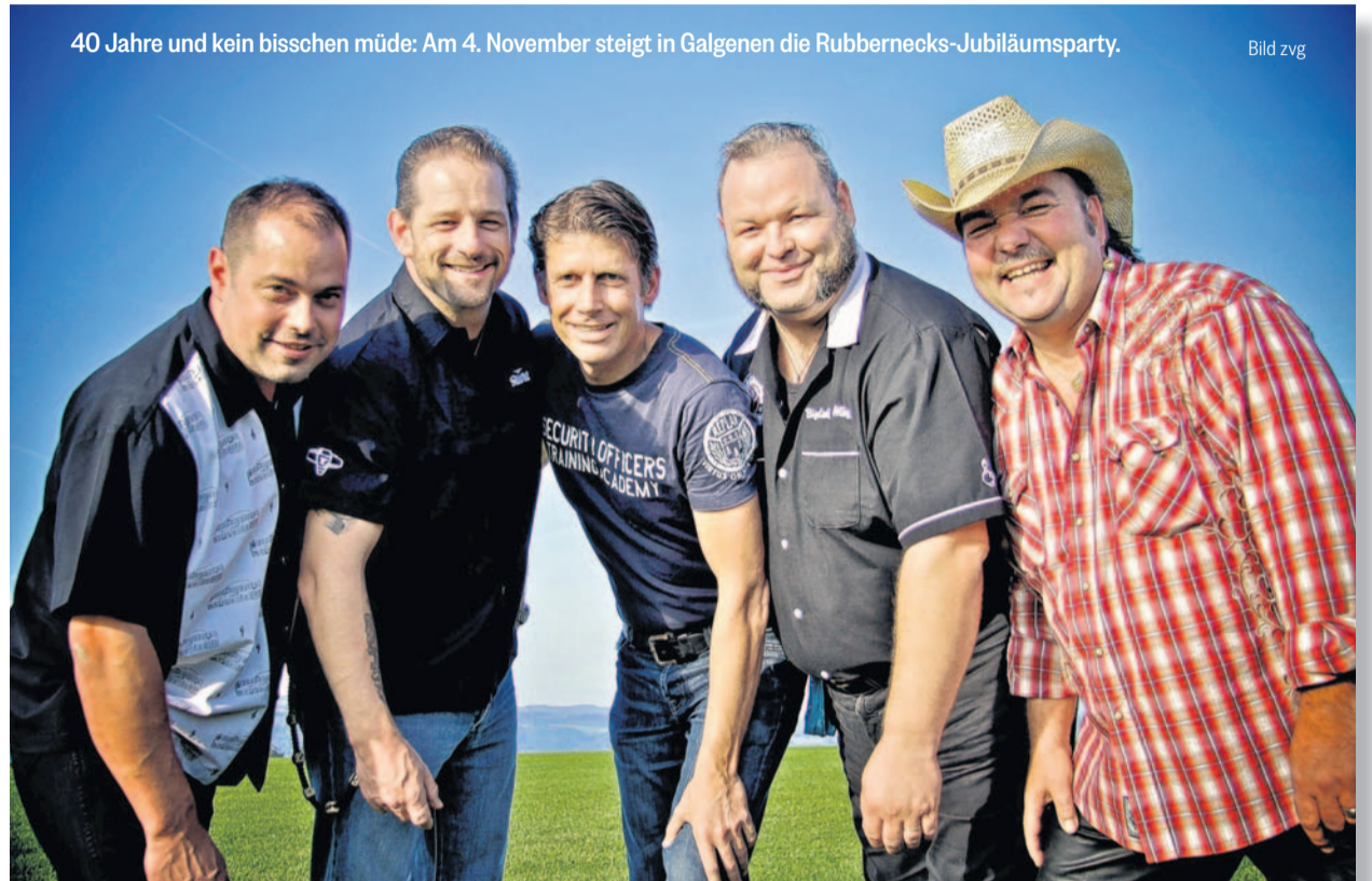
40 Jahre und kein bisschen müde: Am 4. November steigt in Galgenen die Rubbernecks-Jubiläumsparty.

Bereits angelaufen ist der Ticket-Verkauf, und zwar auf www.ticketino.ch . Rund ein Drittel der 600 Sitzplätze sind bereits weg. Ein paar wenige Stehplätze werden ausschliesslich an der Abendkasse angeboten. (fan)