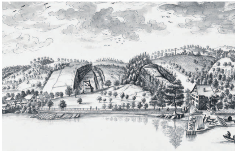
Der «Susthof» (auf der rechten Seite) und die Sägerei am Krebsbach.