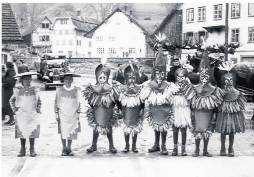
Fasnacht 1918 auf dem Bächer Dorfplatz.

Die irgendwie geartete Verwertung von in diesem Titel abgedruckten Inseraten oder redaktionellen Beiträgen oder Teilen davon, insbesondere durch Einspielung in einen Online-Dienst, durch dazu nicht autorisierte Dritte ist untersagt. Jeder Verstoss wird gerichtlich verfolgt.