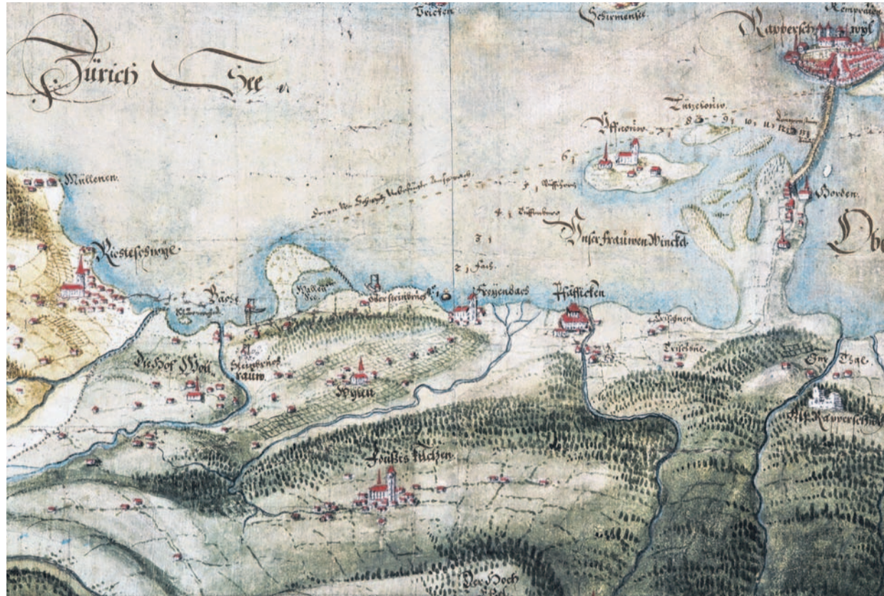
Die «Gyger-Karte», eine Trouvaille mit starker Zeitzeugenaussage.

Ein Stich von zirka 1800 mit Blick von der alten Wollerauerstrasse über Hinterbäch in Richtung Ausserbäch und dem Walenseeli zeigt ein präzises Landschaftsbild und einige markante